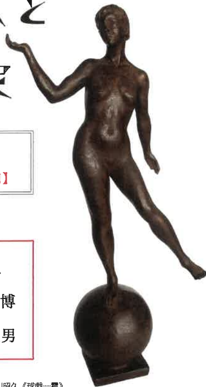
翠川昭久《球戯一農》 1993年、ブロンズ（個人蔵）