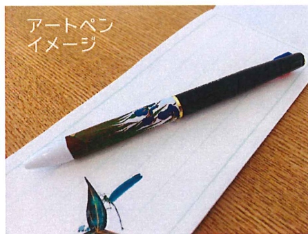
アートペンイメージ

美術館作品画像を素材にデコパージュで「アートペン」を作りながら、その作品の「著作権」について学び、さらに学芸員の解説つきの作品鑑賞も！