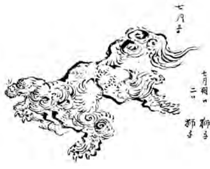
葛飾北斎筆「日新除魔図」