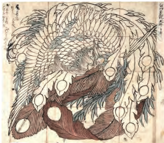
葛飾北斎 岩松院「鳳凰図」下絵