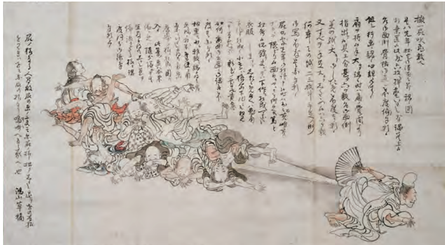
高井鴻山から北斎にあてた手紙。「放屁の図」と呼ばれている