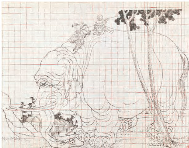
葛飾北斎「象と唐人図」の下絵