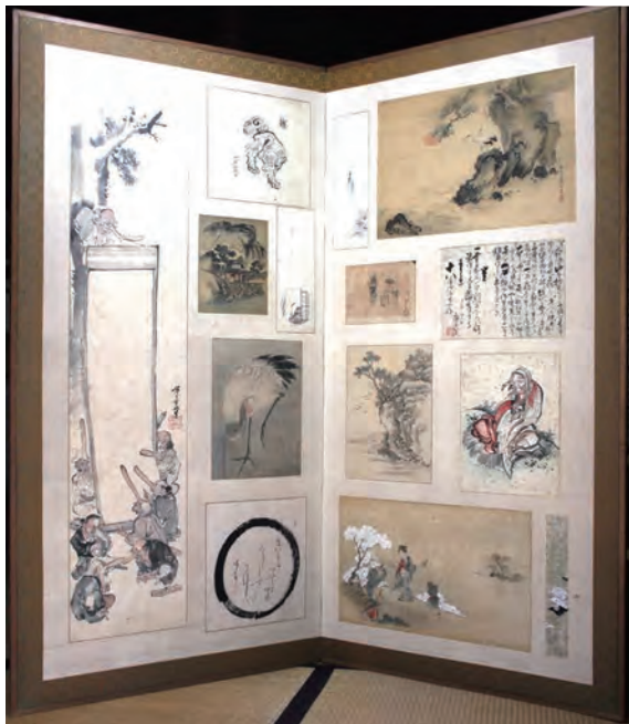
葛飾北斎の手紙(右側上から2番目)と「日新除魔図」(左側上)のある貼り混ぜ屏風